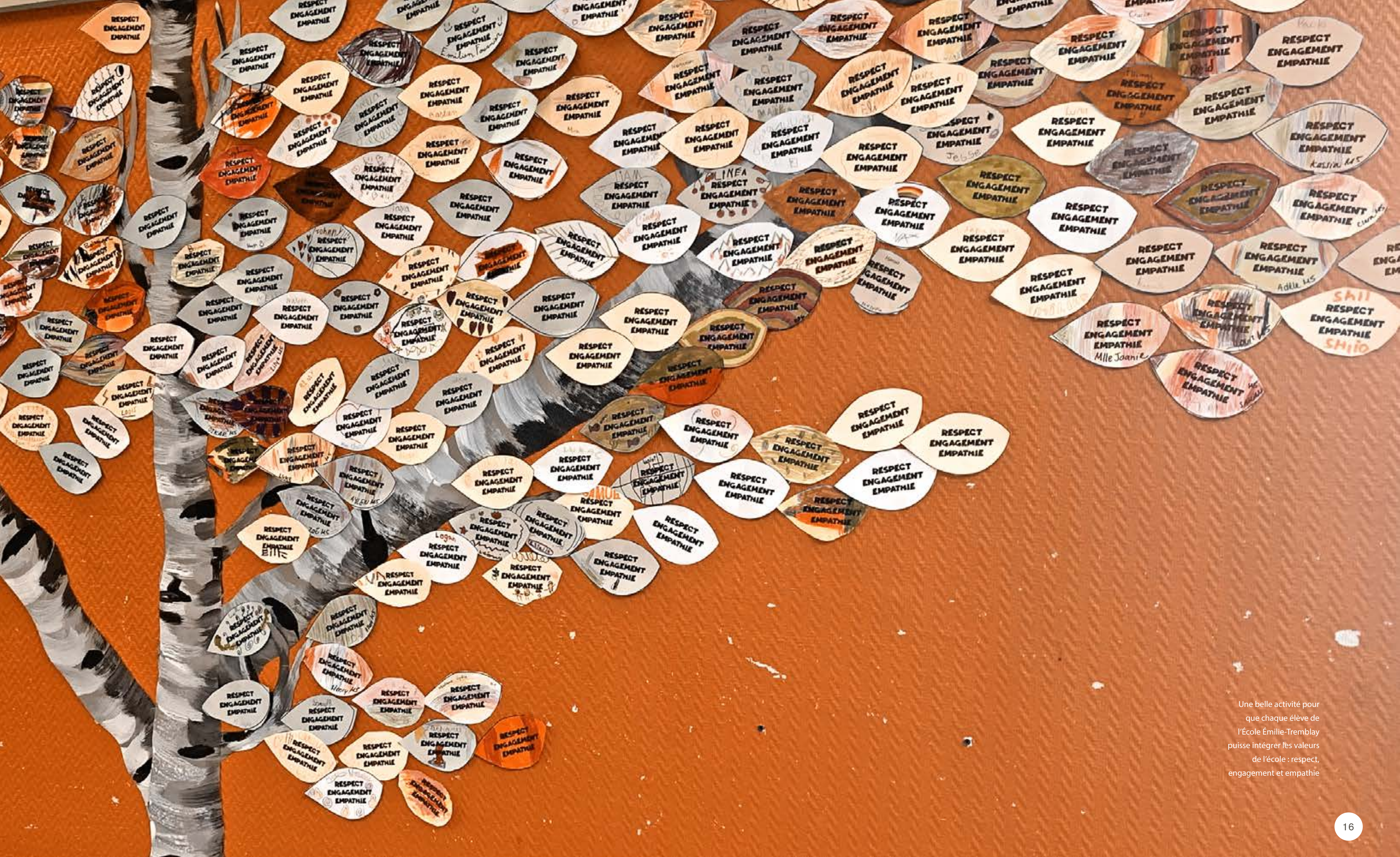
Une belle activité pour que chaque élève de l'École Émilie-Tremblay puisse intégrer les valeurs de l'école : respect, engagement et empathie