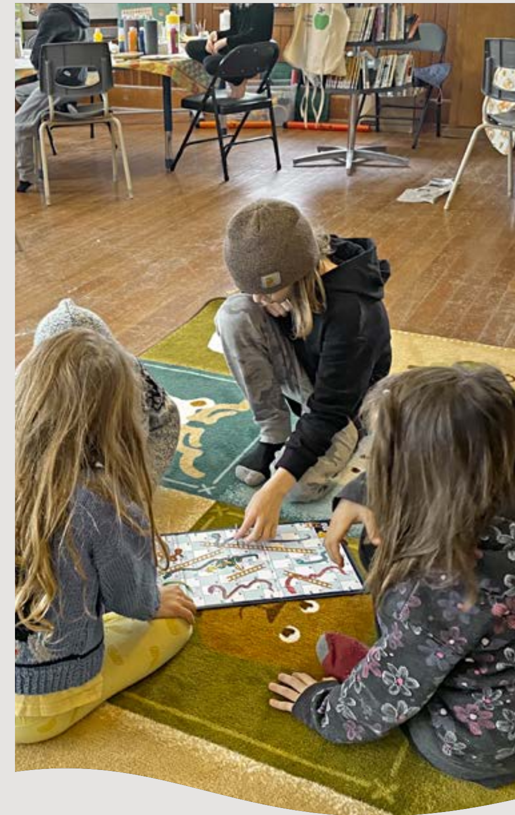
Des enfants utilisent les ressources du Centre francophone de Dawson.