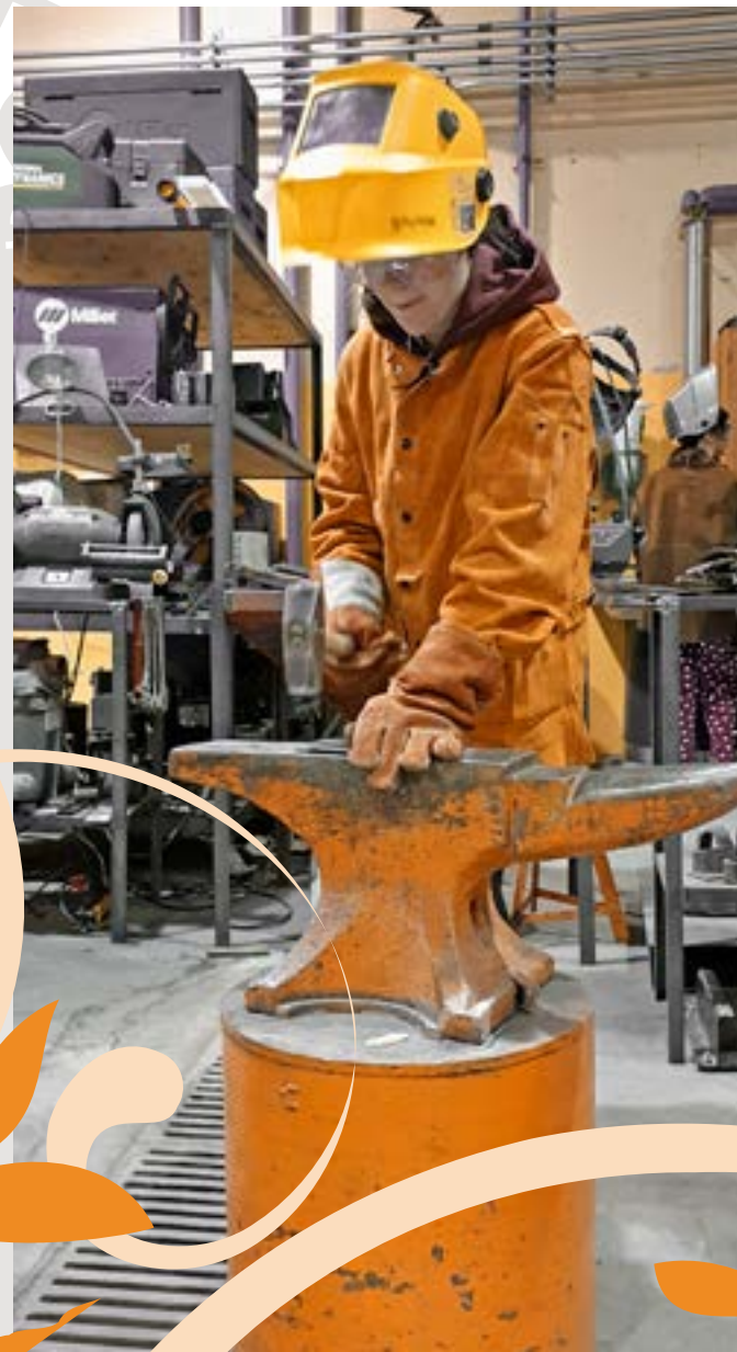
Les élèves de 8 e année du CSSC Mercier ont participé aux ateliers offerts par Yukon Women in Trades and Technology.

La CSFY félicite également les élèves qui ont terminé leurs études au CSSC Mercier en juin 2022 et qui ont reçu sa bourse des langues officielles accompagnée du certificat de bilinguisme. Chaque année, la CSFY remet cette bourse d'une valeur de 1 000 $ à ses élèves qui ont étudié à temps plein, ont reçu leur diplôme d'études secondaires et qui ont réussi les cours de français et d'anglais langues premières de 10 e , 11 e et 12 e années. Cette année, 8 élèves ont reçu cette bourse ainsi que le certificat de bilinguisme qui l'accompagne.