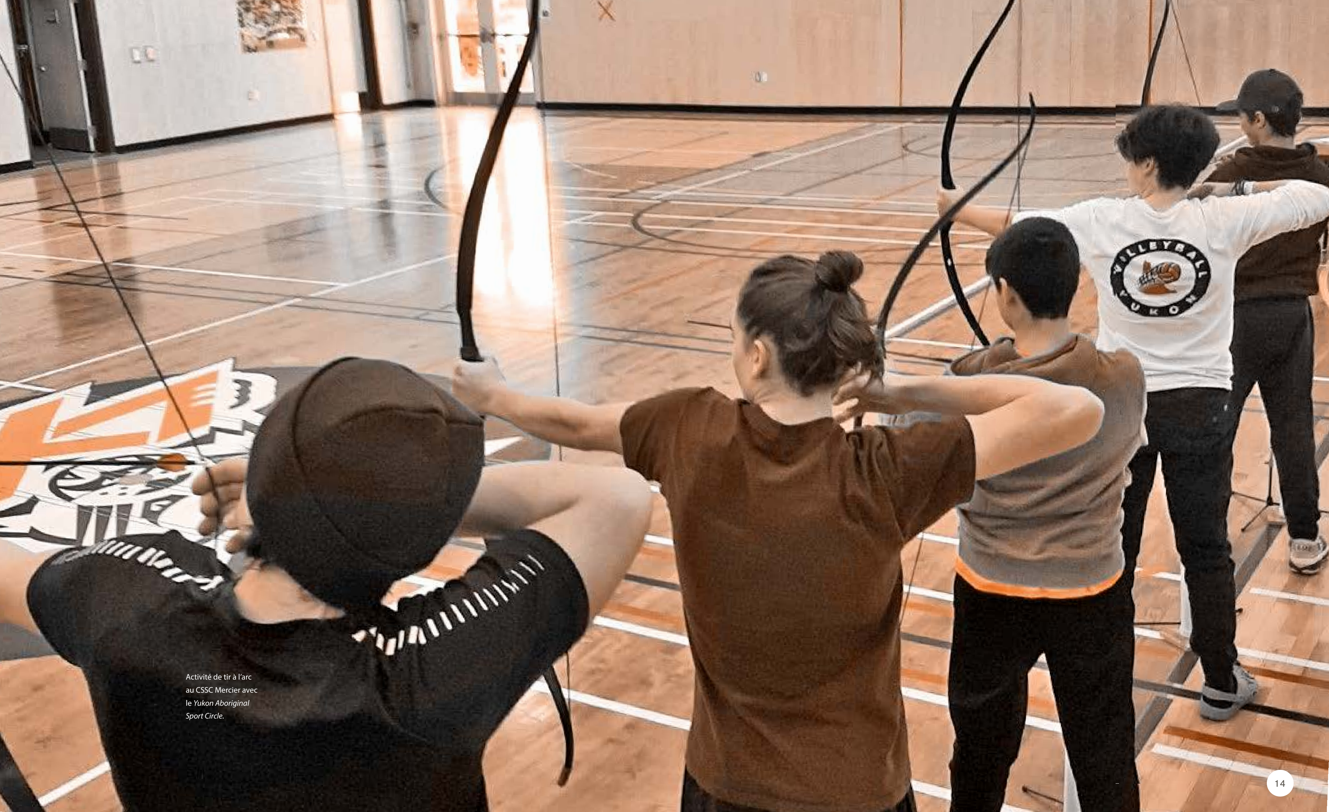
Activité de tir à l'arc au CSSC Mercier avec le Yukon Aboriginal Sport Circle.